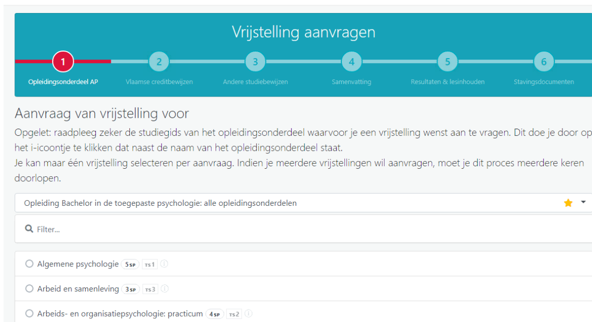
Figuur 2: stap 1

In stap 2 kies je een Vlaams creditbewijs op basis waarvan je de vrijstelling aanvraagt. Enkel Vlaamse creditbewijzen behaald onder diplomacontract vanaf 2008-09 worden in de lijst weergegeven.