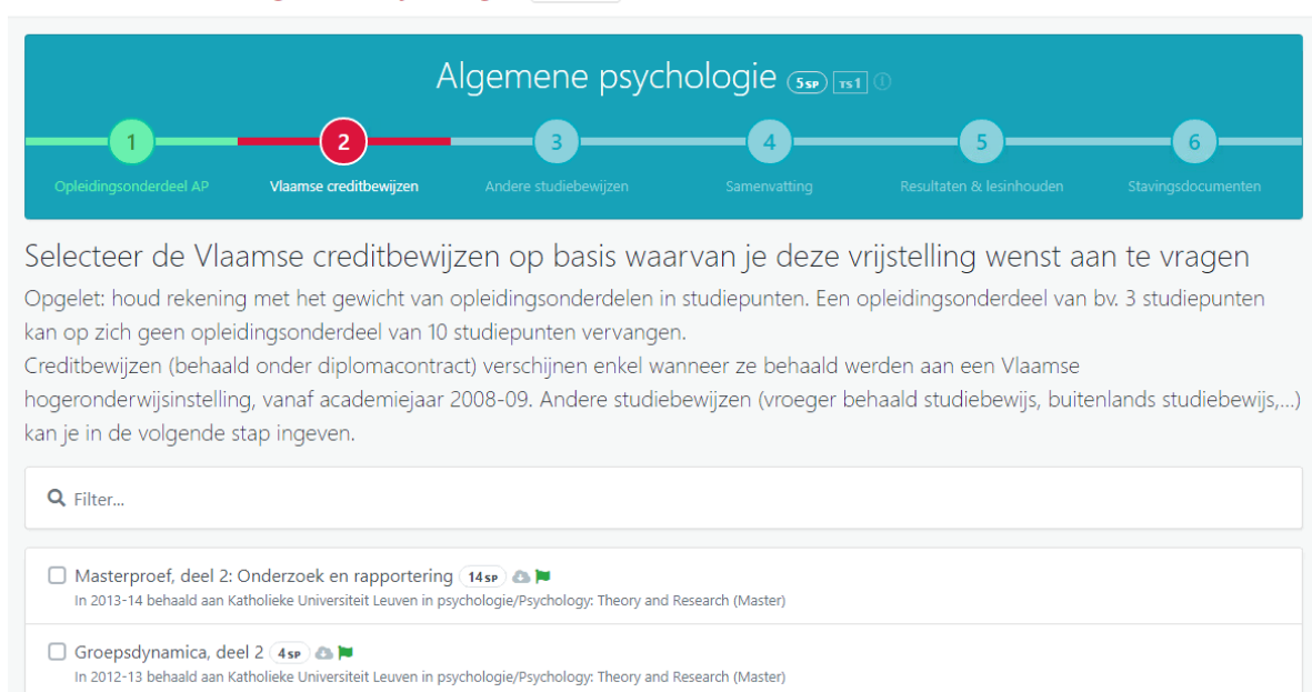
Figuur 3: stap 2

Is deze lijst leeg of wens je een ander studiebewijs (ouder studiebewijs, buitenlands studiebewijs, ...) te gebruiken? Dan kan je dit ingeven in de volgende stap.